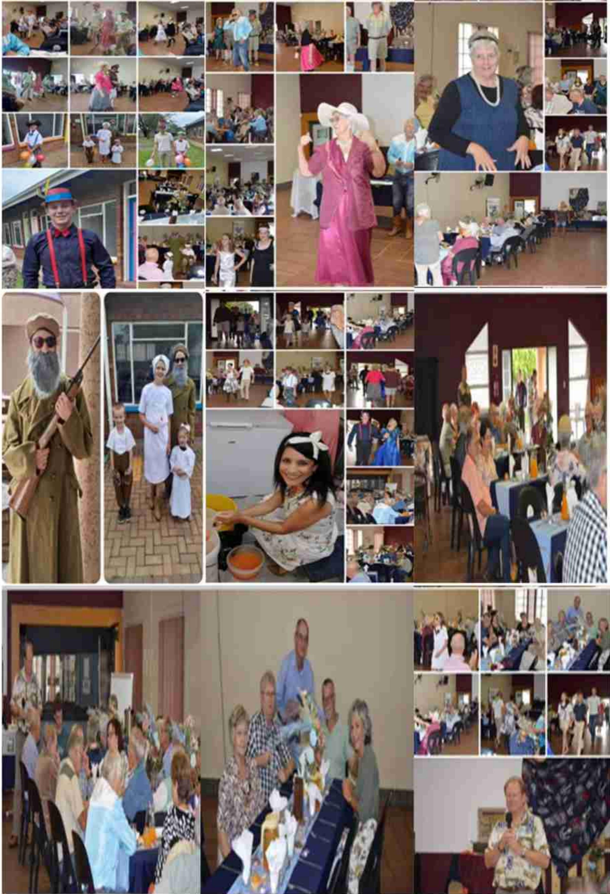
2026 Visie vir Deo Credo Familie Kerk: "Keer terug na God."